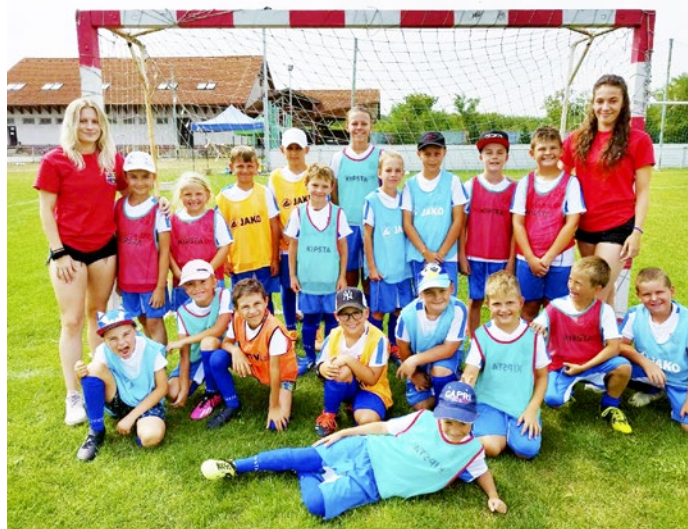
S profesionálnymi futbalistkami MFK Ružomberok

Novinka na Slovensku zavítala do Hanisky