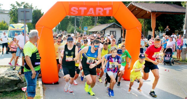
Štartujeme a povzbudzujeme