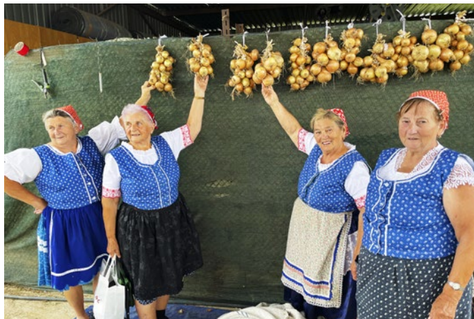
Urodila sa aj kvalitná cibuľa

„A za našu stodolečku fizola, take struki jako ruki dokola, prišol mili včera večer opili, vytrhal mi šicke struki z fizoli...“