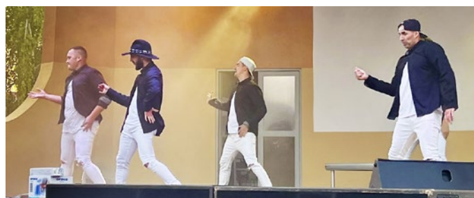
Tanečníci z Phantoms Crew