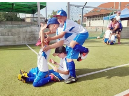
Zábava a šport patria k sebe