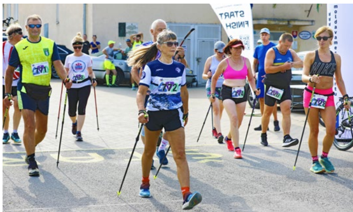
Novinka na pretekoch i v regióne - nordic walking