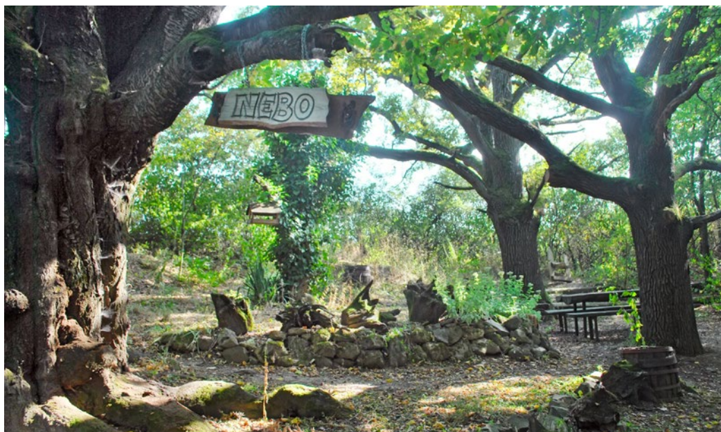
Čarovné miesto Nebo-peklo v slanskom podhorí nad Vyšnou Myšľou

ním úžlabina. Prečo taký názov? Starosta vysvetľuje: „Keď sme toto miesto – svojho času husto zarastené krovínami – presekávali, bola to fuška, hotové peklo! No keď sa objavila