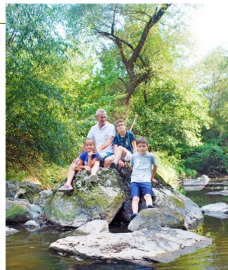
Riečka Olšava a uprostred nej deti so svojim starostom