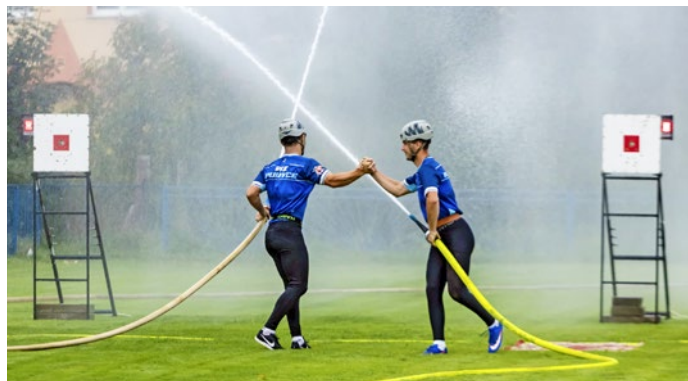
Osvieženie padlo vhod každému