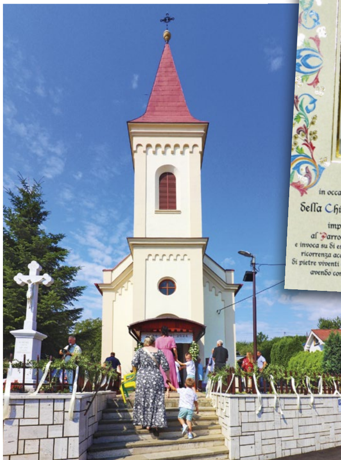
Chrám prešiel opravami v rokoch 1968, 1986 – 1987 a 2016