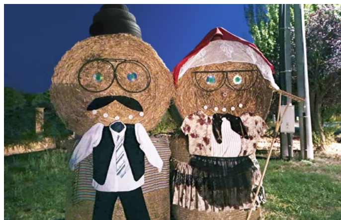
Postavičky zo slamy ozdobili Sokolany na rozlúčku s letom