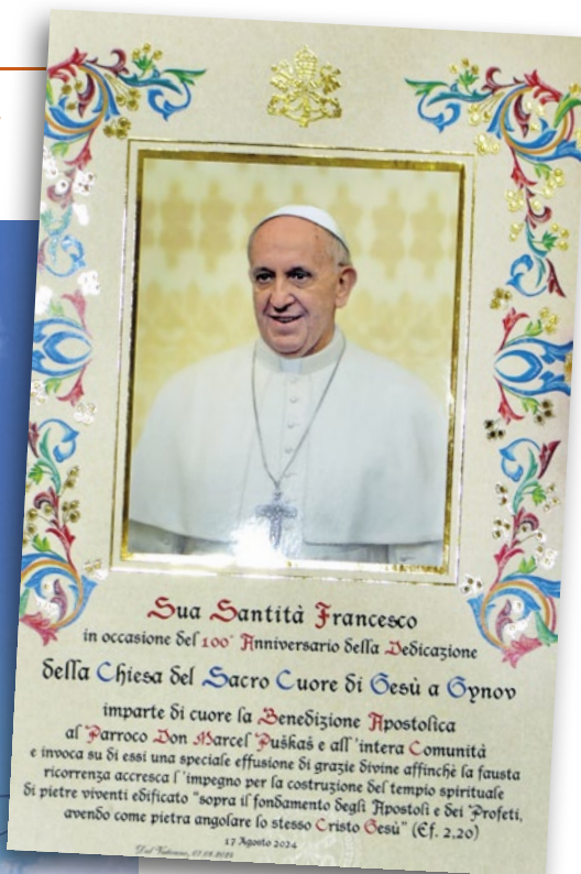
Pápežské požehnanie v taliančine

zvýšila odhodlanie budovať duchovný chrám zo živých kameňov, postavený „na základoch apoštolov a prorokov, ktorých základným kameňom je sám Kristus Ježiš“. Blahoprajný list poslal