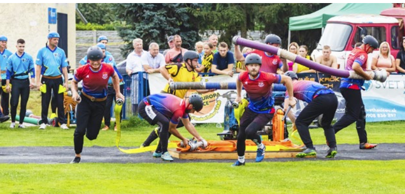
Domáci tím Kokšova-Bakše v akcii