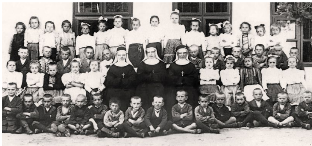
Rok 1929 - 1. trieda so sestrami Sv. kríža

Ich činnosť a prítomnosť sa ukázala ako veľmi potrebná. Čoskoro k škole, nad ktorej bránou visel nápis „Vychovávajúce mládež v láske k Bohu a vlasti!“ pribudol chudobinec, nemocnica