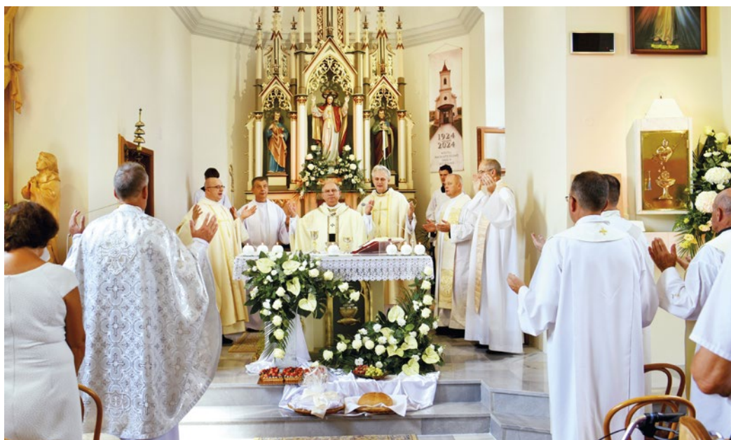
Na slávnosť prišli aj kňazi, ktorí v Gyňove pôsobili